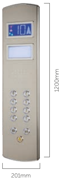
KABINENTABLEAU IN EDELSTAHL, GLÄNZEND MIT IRIS 7" / COP IN MIRROR FINISH WITH IRIS 7"