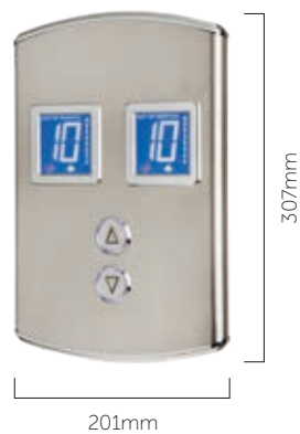
PLACA DOURADA COM FORMATO TFT ESPECÍFICO / PANEL DORADO CON FORMATO TFT