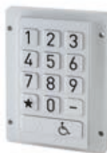
SPECIAL Accessibility design model