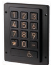
Version noire chiffres or / black version with gold legends