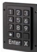
Version noire / black version