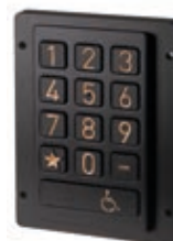
Черная версия с золотыми цифрами / black version with gold legends