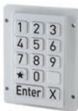
СТАНДАРТНАЯ МОДЕЛЬ / STANDARD MODEL